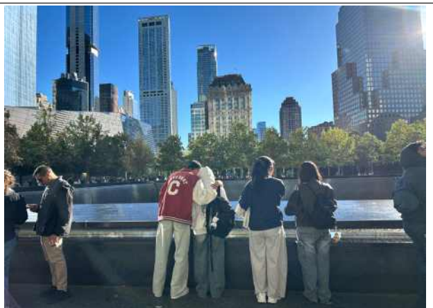
국립 9·11 테러 메모리얼