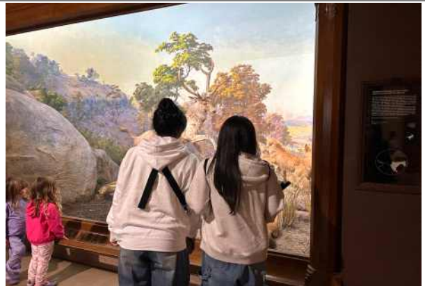
맨해튼 자연사 박물관