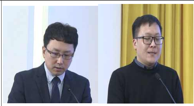
인사말씀-중국사무소장, 융합미디어센터 당위서기