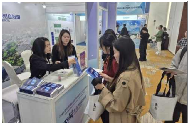
지역특화형비자 안내 및 상담