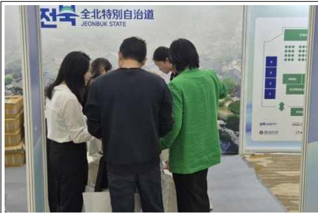
우리도 홍보부스 운영