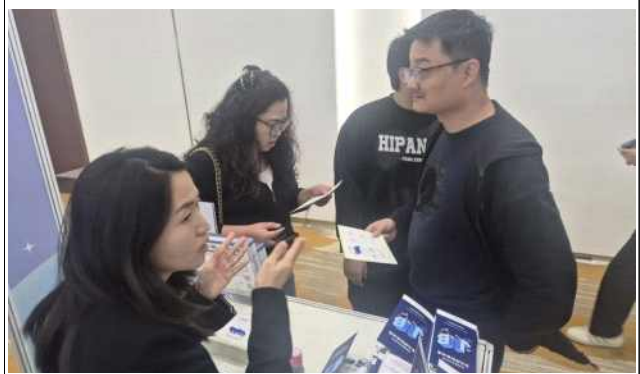
박람회 스탬프 투어