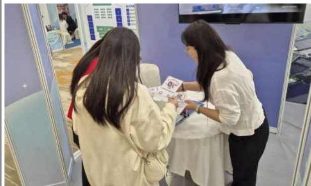
전북 퀴즈 운영