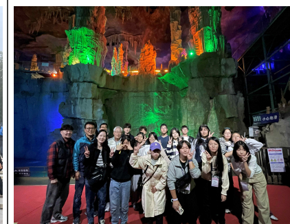
▲ 태산(좌), 태산지하용궁(우)