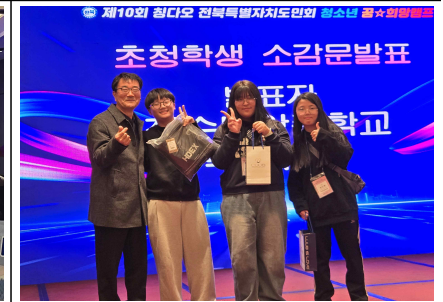
▲ 재청다오전북도민회 청소년 꿈·희망 캠프 10주년 기념행사